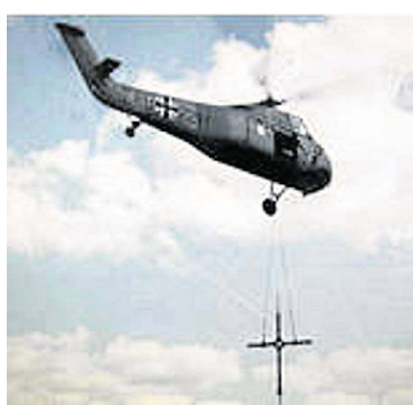
Nahaufnahmen wie diese waren 1959 noch sehr selten: Werner Niederastroth hat den Sikorski-Hubschrauber Typ H 34 der Bundeswehr fotografiert.