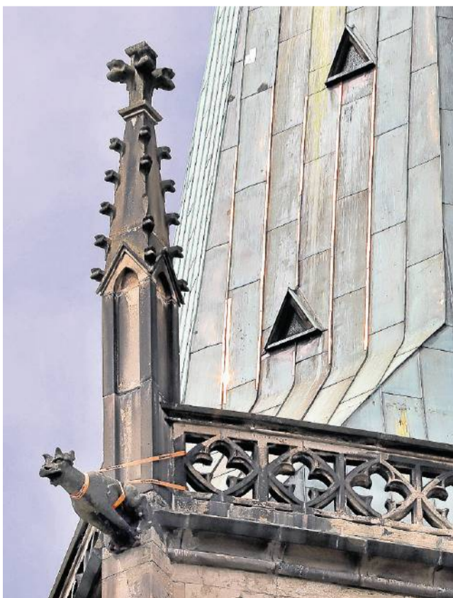
Die Kupferstreben an der Ostseite der beschädigten Kirchturmhaube sind eine Sicherungsmaßnahme.